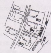
SCARA 1: 2880

DUPA ATRIBUIRE NR. CADASTRAL ..... 115922